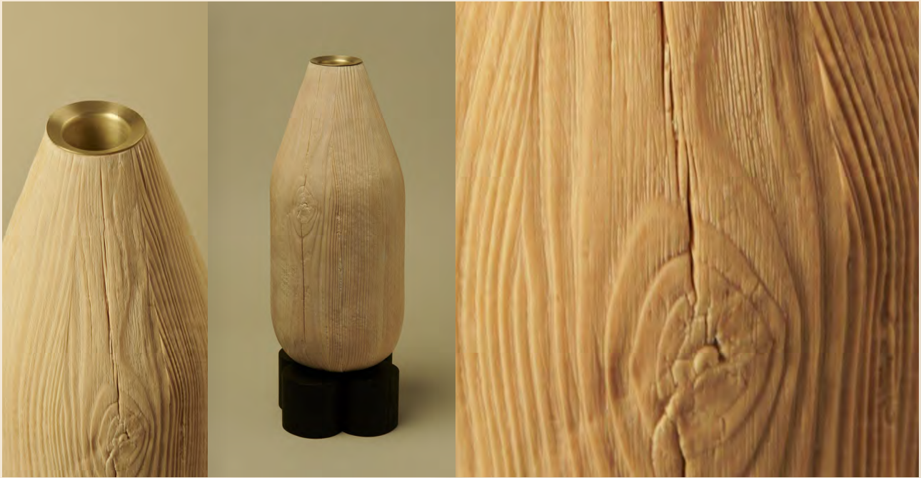
Incrustation sur moulage - Lusur Naturae, E. PAPON - Thibault HUGUET