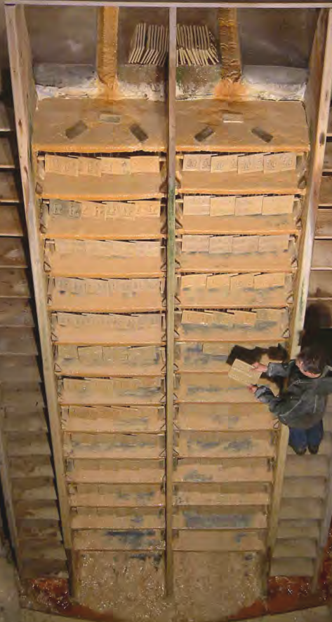
Vue partielle de la Fontaine Pétrifiante