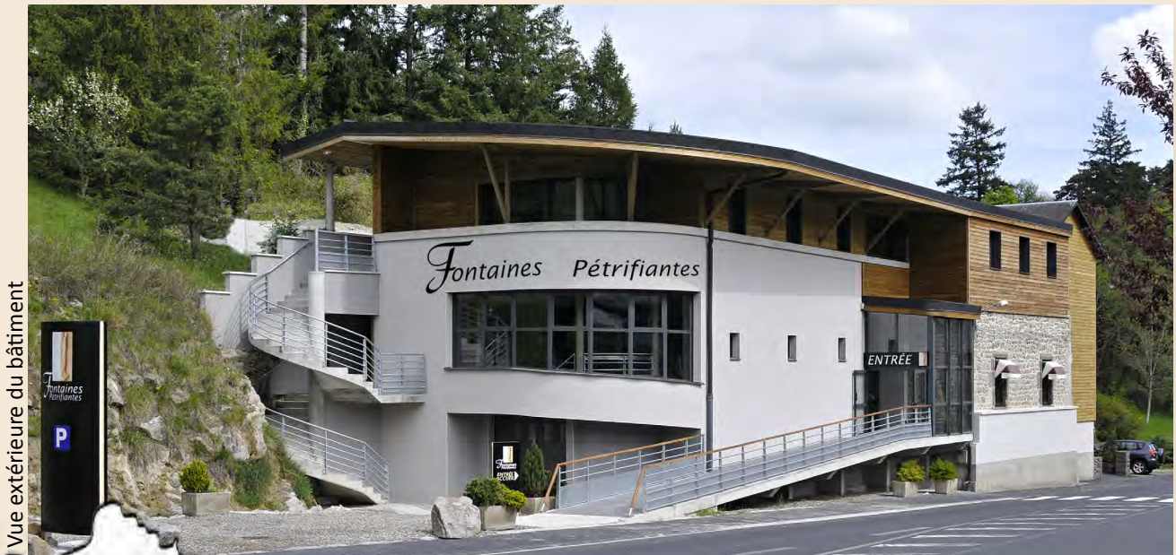
Vue extérieure du bâtiment