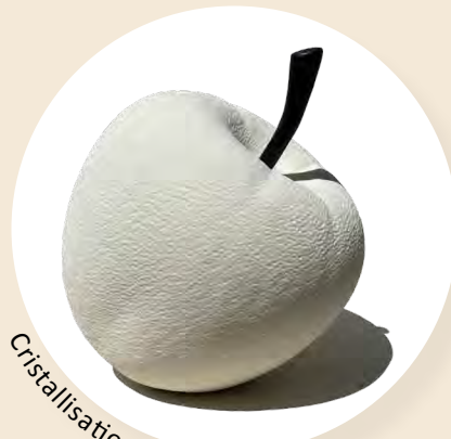
Cristallisation - E. PAPON

C' est l'histoire de la goutte d'eau, de son parcours souterrain dans les entrailles de la terre, durant lequel elle se charge en carbonates de calcium jusqu'à son point d'émergence : la source.